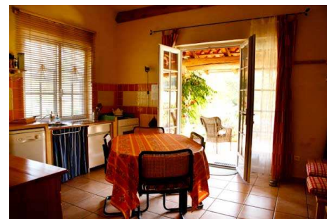
Studio, Wohnküche anderen Seite