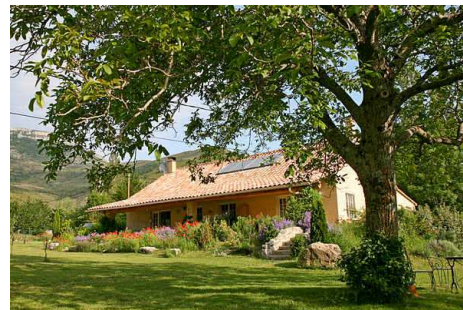
Case Ocre und der Garten mit Nussbaum

Miete: wochenweise, von Samstag zu Samstag. Für eventuelle andere Vereinbarungen nehmen Sie bitte Kontakt mit uns auf.