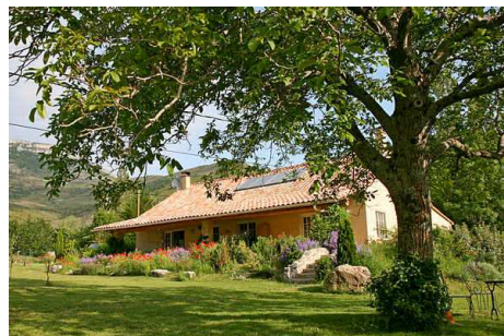
Case Ocre et le jardin avec grand noyer

Ouvert tout l'année. Location de Samedi au Samedi. Pour autres arrangements nous contacter s.v.p.