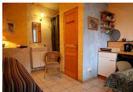
La chambre individuelle