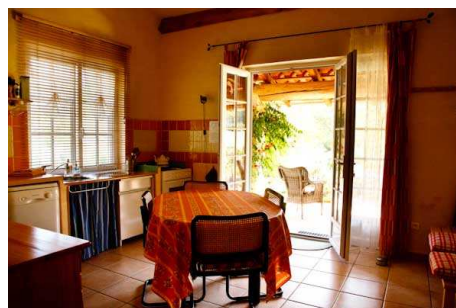
Studio, séjour-cuisine une autre vue