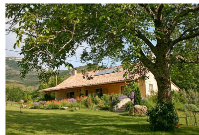
Case Ocre en de tuin met de grote notenboom

Verhuur van zaterdag tot zaterdag. Eventuele andere mogelijkheden in overleg.